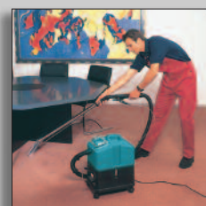
Machine in actie