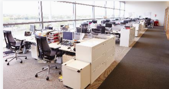
Overheidsdiensten en -kantoren